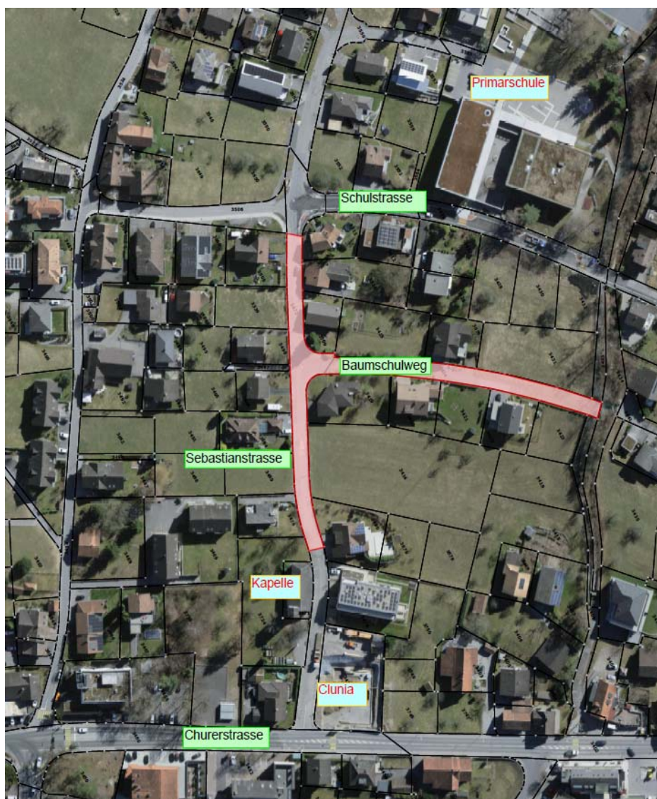
Abbildung 1: Projektperimeter